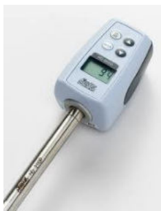
calibratore DELTA OHM mod. HD2020

Prima e dopo l'effettuazione delle misure è stata eseguita la calibratura del fonometro