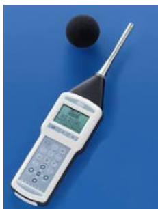
Fonometro integratore di classe I DELTA OHM mod. HD2110

I rilievi sono stati eseguiti con fonometro integratore di classe I DELTA OHM mod. HD2110 classe 1, numero di serie 10092432329, conforme alle prescrizioni della norma IEC 804 classe I, IEC 651 classe I, IEC 225 filtri 1/3 di ottava, IEC 537 filtro ponderazione D e BS 6402 per la dose; microfono MK221, numero di serie 34747. Il fonometro è stato controllato prima e dopo l'intervento con calibratore DELTA OHM mod. HD2020, conforme alla classe di precisione I delle norme IEC 942, numero di serie 10017456